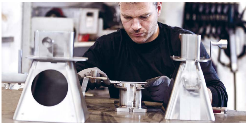
Brimas producerer kundespecifikke specialopgaver i rustfrit stål, aluminium og jern.

”Systemet har store fordele i forhold til dokumentation og har ligeledes en rigtig god søgefunktion, så man altid kan finde tilbage i tidligere bilag. Så kan man se, hvad man har købt tidligere og sammenligne ting og sager, men mest af alt giver det en effektivitet i vores bogholderi”. Det